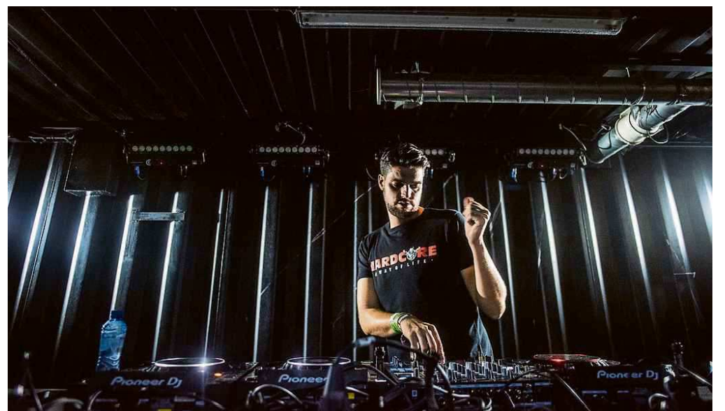
Dither: beuken met een missie.