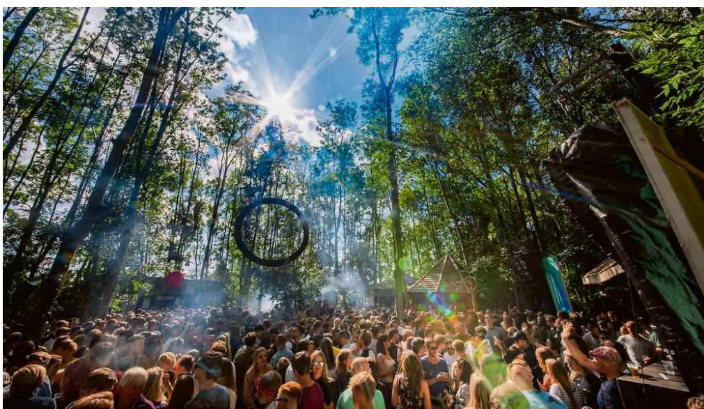
Het Forest Stage in het bos bij de ringweg.